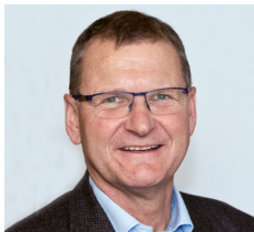
Andreas Ermacora Präsident des Alpenvereins Österreich

„ Der Tourismus zählt zu den zentralen Stützen der heimischen Wirtschaft. Die traditionelle Gastfreundschaft, hervorragende Kulinarik und einzigartige Natur sind besondere Alleinstellungsmerkmale der Urlaubsdestination Österreich. Die Verhaltensregeln auf Almen und Weiden leisten einen wichtigen Beitrag, damit dies auch in Zukunft so bleibt. “