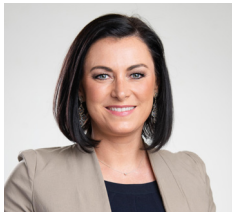
Elisabeth Köstinger Bundesministerin für Landwirtschaft, Regionen und Tourismus

„ Das gute Miteinander von Landwirtschaft und Tourismus auf Österreichs Almen ist mir wichtig. Die Bäuerinnen und Bauern bewirtschaften unsere Naturlandschaften, die Gäste bringen Wertschöpfung in die Region. Mit klaren Verhaltensregeln für die Besucher stärken wir dieses Miteinander für die Zukunft. “