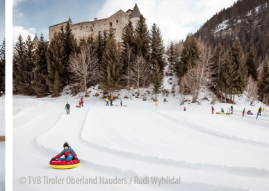
© TVB Tiroler Oberland Nauders / Rudi Wyhlidal